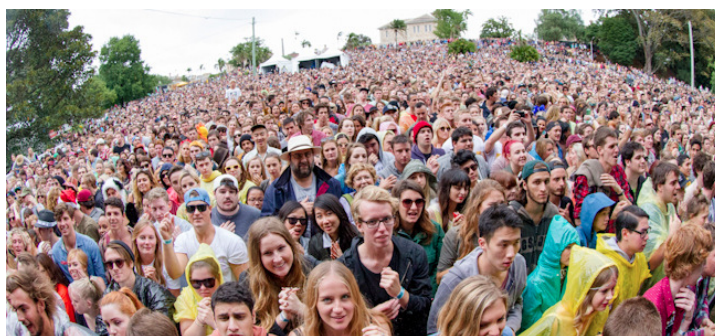
14. heti nyitásunknál az Egyetemisták parkjáig állt a sor