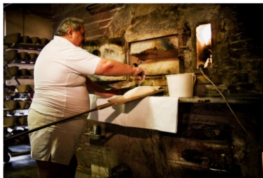
Az egyik új péklapátunkat épp felavatja egy öregtagunk.