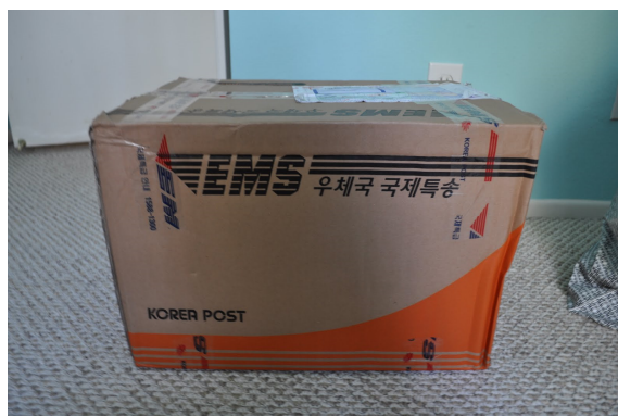
Megérkeztek az új péksnéglerek