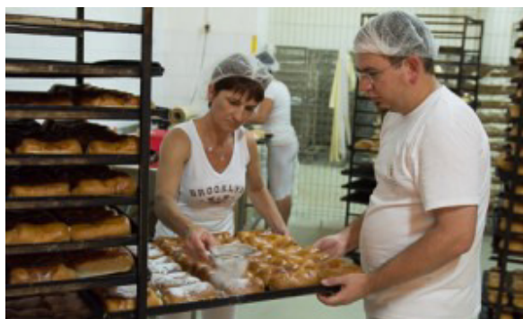
Két újonc az új polcokra pakol a raktárban.